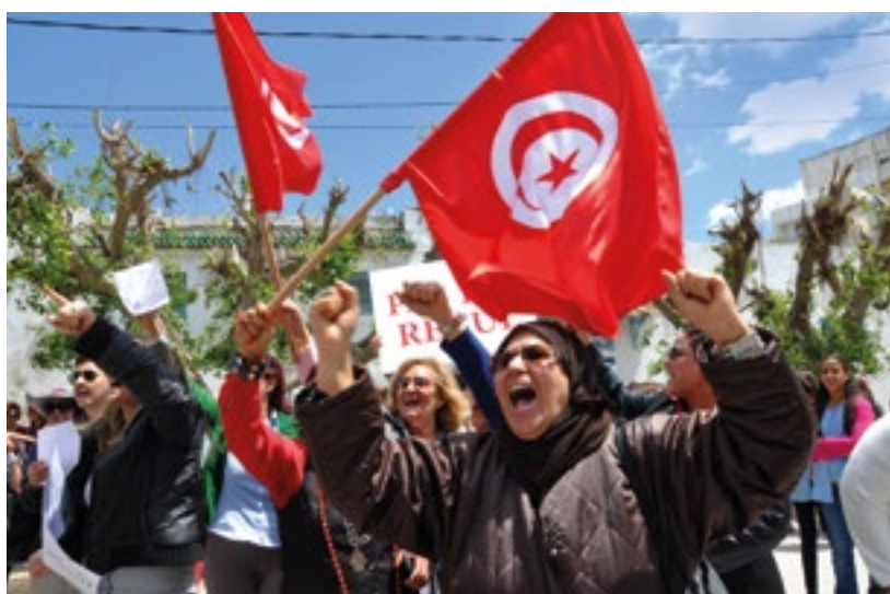
Mujeres se manifiestan ante la Asamblea Constituyente de Túnez para exigir que haya paridad en la ley electoral, Túnez (2014).

La extrema desigualdad actual nos perjudica a todos. En la práctica, para las personas más pobres de la sociedad, ya vivan en África subsahariana o en el