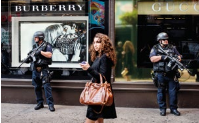
Una mujer pasa delante de dos policías fuertemente armados que hacen guardia delante de unos grandes almacenes en Manhattan (2008).

ciudades más peligrosas del mundo, 47 y allí se han perpetrado un millón de asesinatos entre los años 2000 y 2010. 48 Es peligroso vivir en un país con una desigualdad elevada.